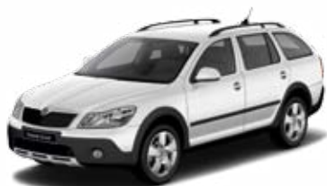
Biela Candy uni