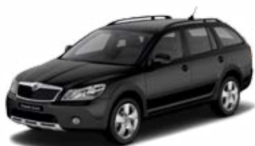
Čierna Magic s perleťovým efektom