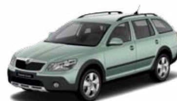
Zelená Arctic metalíza