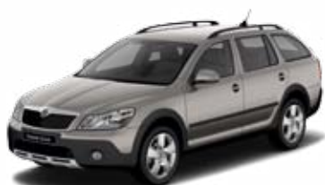
Béžová Cappuccino metalíza