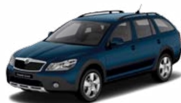
Modrá Pacific uni