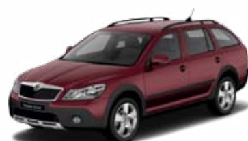
Rosso Brunello metalíza