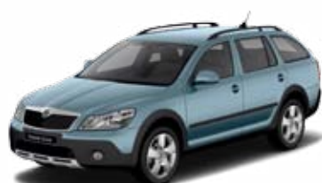
Sivá Satin metalíza