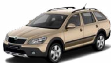
Béžová Safari metalíza