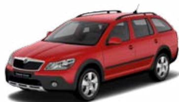
Červená Corrida uni