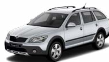
Strieborná Brilliant metalíza