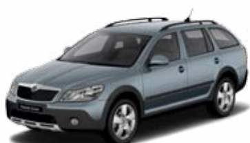
Sivá Platin metalíza