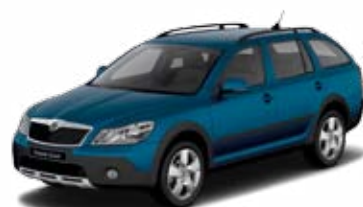
Modrá Lava metalíza