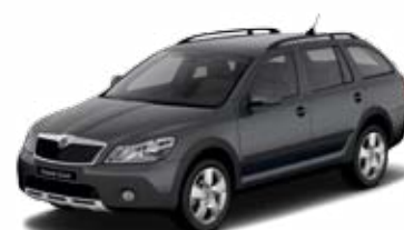
Sivá Anthracite metalíza